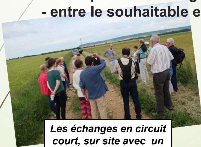
Les échanges en circuit court, sur site avec un paysan boulanger