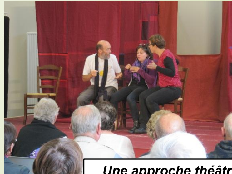
Une approche théâtrale pour parler des difficultés de vie en milieu rural